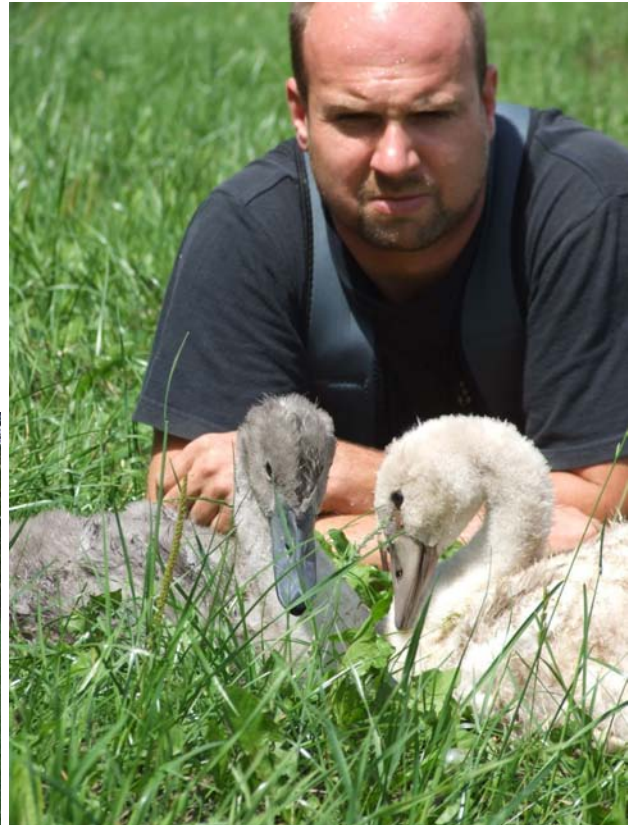
Labutě z umělé líhně po 55 dnech od vylíhnutí (20.7.08)