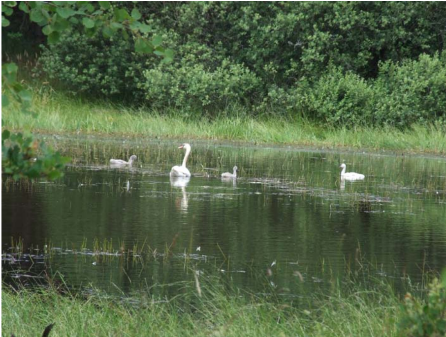
Kontrola (21.6.08) po 26 dnech od transferu - 3 mláďata a samice.